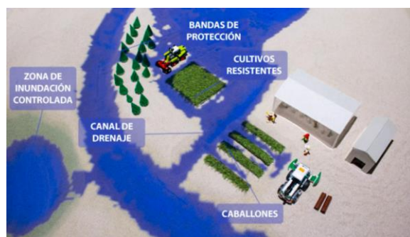
Figura 3. Análisis de medidas de adaptación al riesgo de inundación en explotaciones agropecuarias y cultivos.

El laboratorio en el que se encuentra situada esta instalación recibe decenas de visitas cada año, exceptuando los meses de mayores restricciones durante la pandemia de la Covid-19. La instalación TopoSandBox representa uno de los atractivos de las visitas, ya que permite exponer de una forma interactiva los problemas y soluciones para la adaptación al riesgo de inundaciones. Es habitual que estudiantes universitarios de la rama de ingeniería y