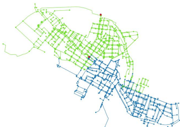
Figura 1. Red de Paterna con 2 sectores

máxima o el porcentaje de nodos que no cumplen con un valor de presión mínima.