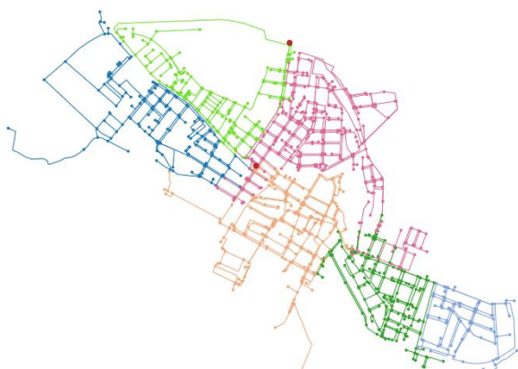
Figura 2. Red de Paterna con 6 sectores